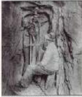
Stollenvortrieb Bad Ischl

STROBL. Die Ausstellung Wohlstandsmaschinen - zur Kriegsgeschichte Österreichs" eröffnet am Freitag, 31. Juli, Corona-bedingt eher sang- und klanglos. Nichtsdestotrotz ist das Gezeigte höchstschenswert - geht es doch um den Wohlstand, von allen gemeinsam erarbeitet in diversen Industriebetrieben. Bis vor kurzem lief sie noch rund, die Wohlstandsmaschine, betrieben von unzähligen Händen