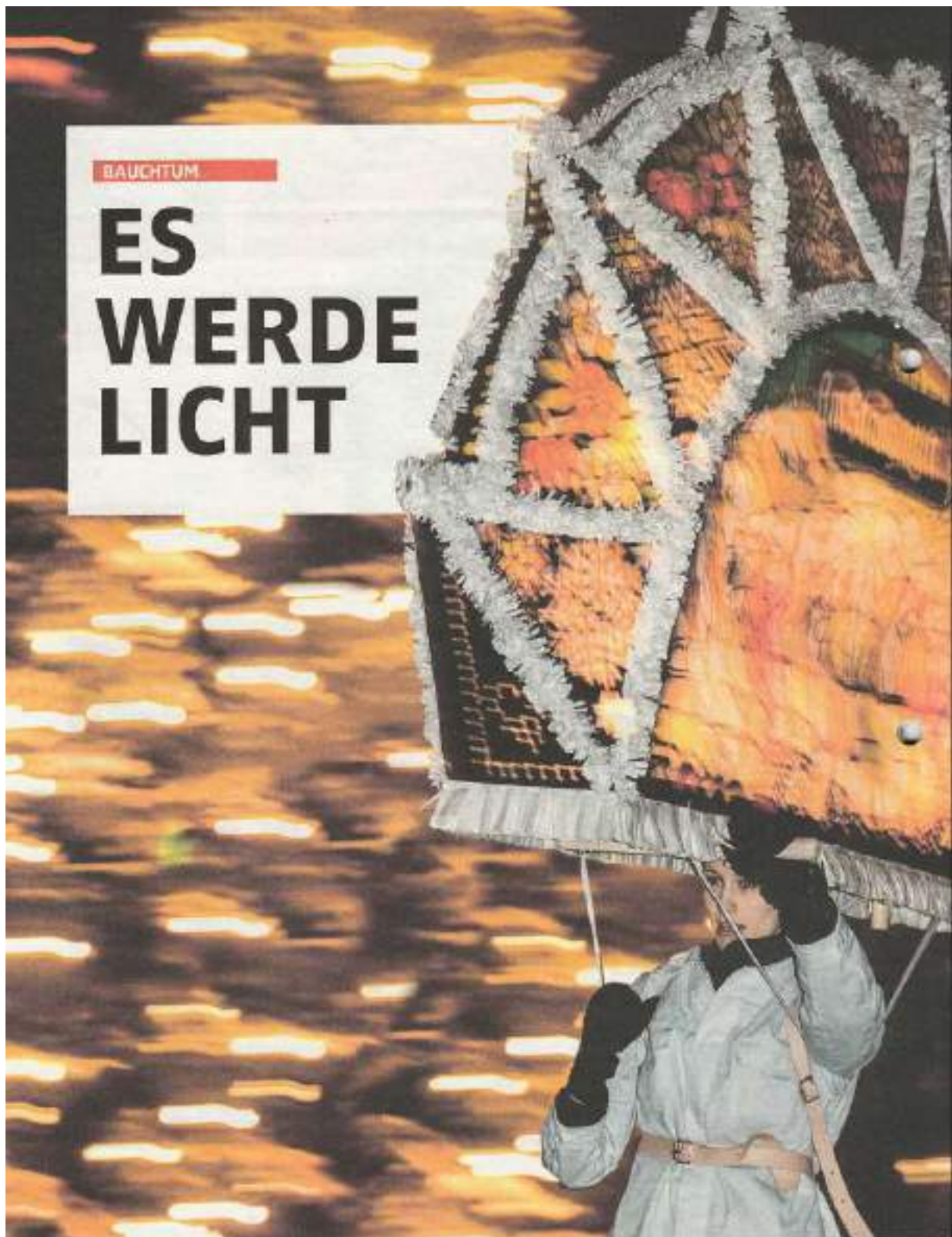
ABBILDUNG 17- HOAMATLAND WINTER 2020, S.36