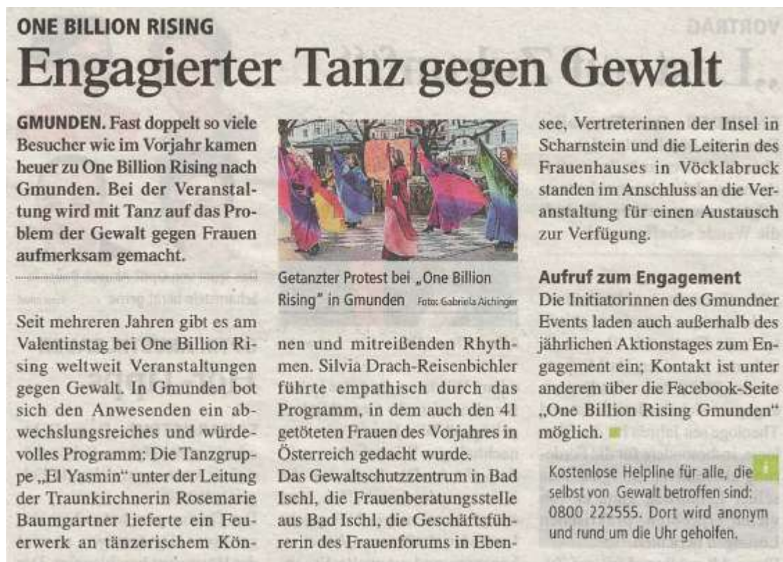
ABBILDUNG 1- TIPS GMUNDEN, 8 WOCHEN 2020