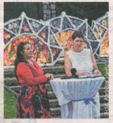
ABBILDUNG 10- TIPS GMUNDEN, 36. WOCHEN 2020

EBENSEE. Im Rahmen der Buchpräsentation zu „28 Göttinnen“ von Thea Unteregger holte das Frauenforum Salzkammergut für einen Abend die Glöcklerinnen-Kappen aus dem Sommerschlaf. Die zahlreichen Gäste der Veranstaltung erfuhren im Kreis der beleuchteten Kappen Hintergründe und Gemeinsamkeiten weiblicher Figuren in alpenländischen Mythen und Kulturen.