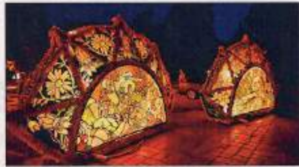
Glöcklerinnen-Kappen der Ebenseer Frauen-Passe.

Vor elf Jahren beteiligte sich das Frauenforum Salzkammergut erstmals mit einer eigenen Frauen-Passe beim Ebenseer