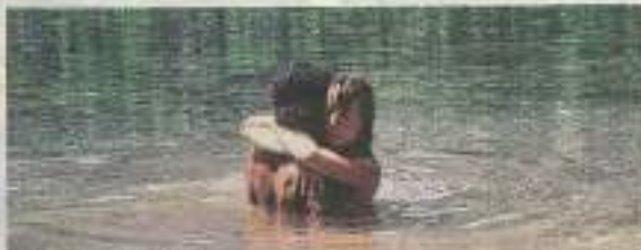
Szene aus „LiebesLeben“