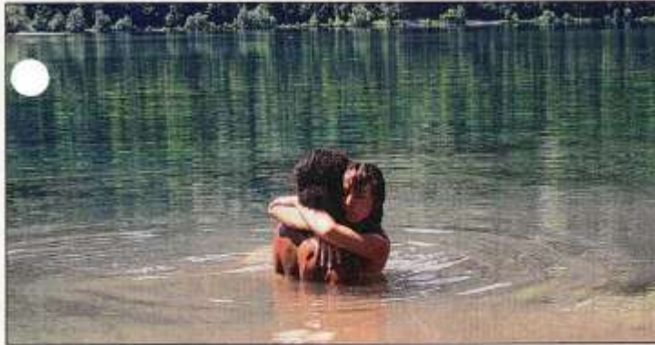
Szenenfoto aus „Liebes:Leben“.