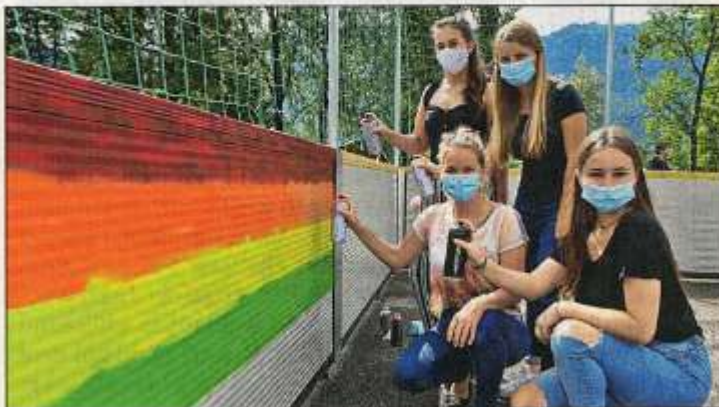
ABBILDUNG 6-ISCHLER WOCHE, 29. JULI 2020

Zohnergirls und Spirit of Team, das JUZ Ebensee und die JG Gmunden an. Mit knapp 50 Teilnehmern wurden die Erwartungen der Veranstalter deutlich übertroffen. Das Ergebnis: Ein bunter, dekorativer Streetsoccerplatz in Ebensee.