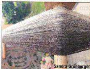
ABBILDUNG 19: ISCHLER WOCHE, 12. JUNI 2024

lernen. Er kann für eine Stunde oder die ganze Zeit über besucht werden. Die Faden-Werkstatt am 27. Juni gewährt von 14 bis 20 Uhr Einblick in die Welt der Fadenerzeugung mit der Handspindel und dem Spinnrad. Die Fachtagung und der Wollmarkt finden am 28. Juni von 14 bis 20 Uhr statt. Alle Veranstaltungen finden auf Spendenbasis nach eigenen finanziellen Möglichkeiten statt.