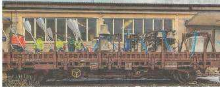
Der in der Lehrwerkstätte der ÖBB Infrastruktur gebaute „Glöggwaggon“ wird durchs Salzkammergut bimmeln.

weitergeben. Je schneller der Zug fährt, desto heftiger wird das Geräusch der Glocken und Schellen.