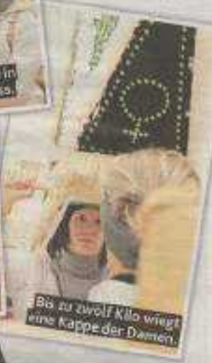
Bis zu zwölf Kilo wiegt eine Kappe der Damen.

Na? Haben Sie den Weihnachts-Wahnsinn gut überstanden? Bei uns war die Stimmung schon am Vortag des Heiligen Abends nicht immer friedvoll und freudig. Denn entgegen der langjährigen Tradition wollten die Kinder den Baum bereits einen Tag früher als sonst schmücken. „Macht doch, was ihr wollt“, zog ich mich eingeschneit zurück. Das Schmücken hat auch super geklappt, nur das Verräumen der Kiste mit der restlichen Weihnachtsdeko sorgte im Nachhinein noch für eine unliebbare Überraschung.