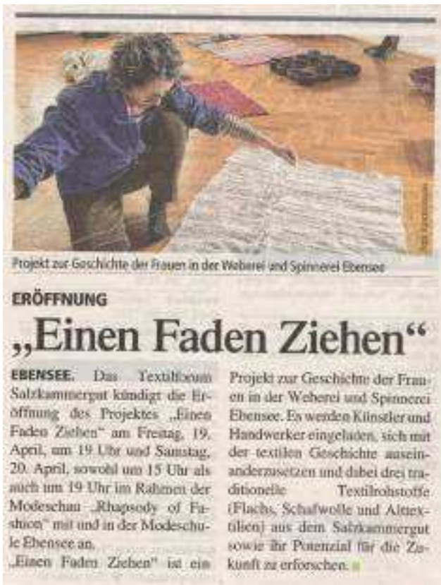
ABBILDUNG 6: TIPS