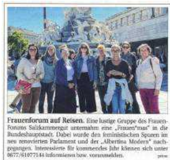
ABBILDUNG 12: ISCHLER WOCHE, 8. MAI 2024