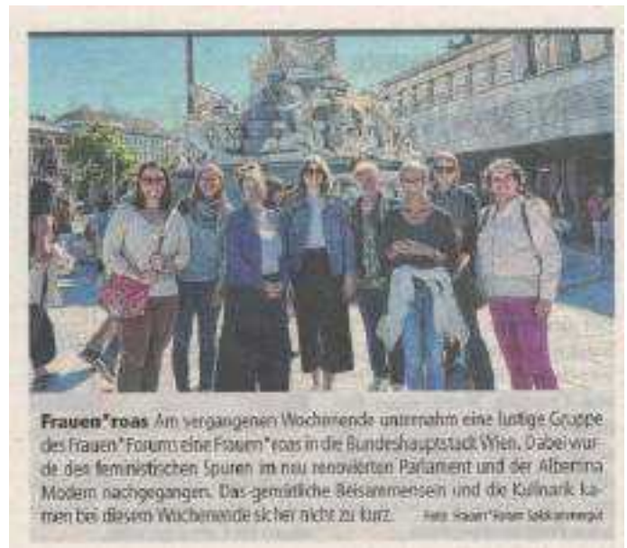
ABBILDUNG 13: TIPS WOCHE 19-2024