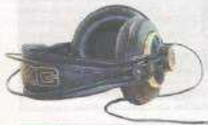
Solo III: HICAMATLAND

Von Roswitha Fitzinger