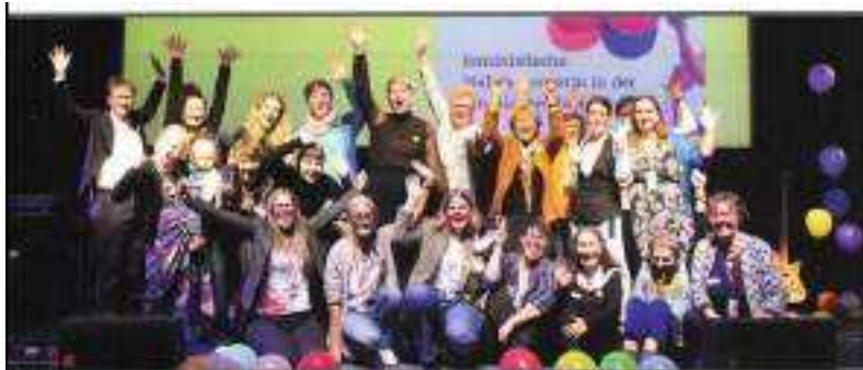
ABBILDUNG 30: ISCHLER WOCHEN, 6. NOVEMBER 2024

EBENSEE. Die Ausstellung „Textile Visionen im Salzkammergut“ ist von Samstag, 9. bis zum 30. November im Museum Ebensee zu sehen. Am Sonntag, 17. November, 15 Uhr, gibt es einen Vortrag von Ernst Tipka zum Thema „Frühindustrielle Wollspinnerei im Salzkammergut“. Der Historiker stellt die bisher wenig beleuchtete hausindustrielle Spinnerei der Region vor. Dabei betrachtet er besonders