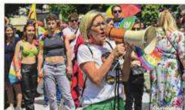
ABBILDUNG 22: ISCHLER WOCHE, 19. JUNI 2024