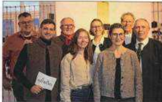
Das Team gemeinsam mit Harald Krassnitzer.