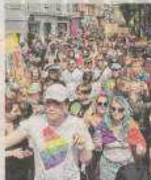
2.000 Menschen nahmen an der Pride-Parade in Bad Ischl teil.

Besondere Freude hatten die Besucher mit einem berühmten Gast: Tom Neuwirth alias Conchita Wurst nahm an der Parade teil und gab am Abend ein Konzert im Sisi-Park. Dass es einmal im Salzkammergut eine Pride geben würde, das habe er sich nicht gedacht, erzählt Neuwirth. „Ich komme ja aus Bad Mitterndorf und ich kann mich noch gut erinnern, was es für mich war, als Teil der queeren Community wenig Anschluss zu haben.“ Gerade deshalb sei es wichtig, als Community sichtbar zu sein und der Mehrheitsgesellschaft zu sagen: „Wir waren immer schon da und wollen zeigen, wie wir miteinander leben können.“