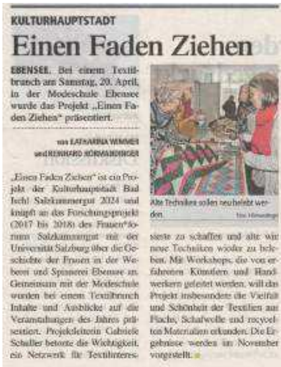
ABBILDUNG 11: TIPS