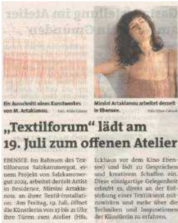
ABBILDUNG 26: BEZIRKSRUNDSCHAU, 18./19. JULI 2024