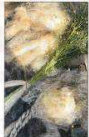
ABBILDUNG 27: ISCHLER WOCHE, 23. OKTOBER 2024

Die Eröffnung ist um 11 Uhr. Ausstellungsdauer: 9. bis 30. November. Samstag und Sonntag 13 bis 17 Uhr. Museum Ebensee, freier Eintritt.