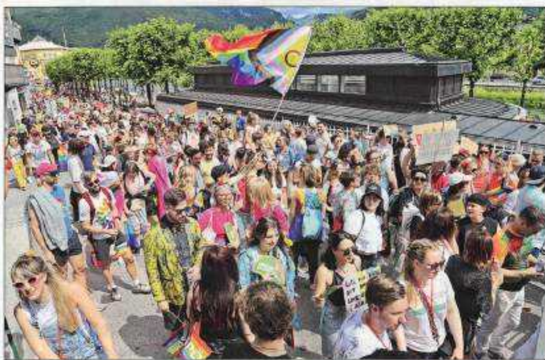
ABBILDUNG 20: ISCHLER WOCHEN, 12. JUNI 2024

Gelungene Premiere. Vergangenen Samstag fand die erste Pride-Parade im Salzkammergut statt. Rund 2.000 Menschen zogen durch Bad Ischl und skandierten ganz im Sinne der LGBTQ+-Community für Toleranz, Gleichberechtigung und Zusammenhalt. Die schönsten Bilder des bunten Treibens sehen Sie ab Seite 26.