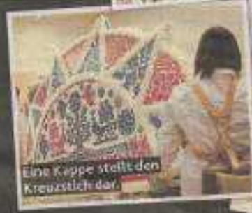
Eine Kappe stellt den Kreuzstich dar.