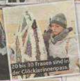
20 bis 30 Frauen sind in der Glöcklerinnenpass.