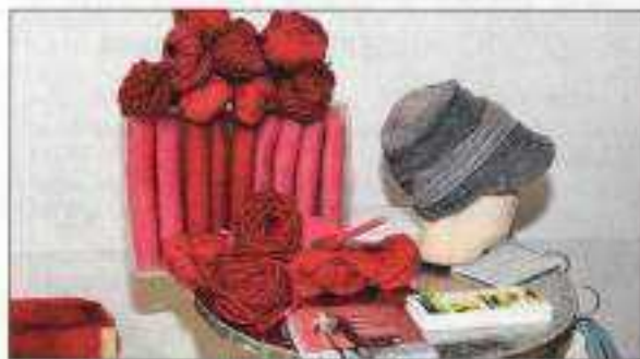
ABBILDUNG 8: ISCHLER WOCHEN, 10. APRIL 2024

Das Projekt „Einen Faden Ziehen“ soll nicht nur eine Hommage an die reiche Textiltradition des Salzkammerguts, sondern auch ein Versuch sein, neue Wege in der Textilproduktion zu gehen. Es soll zeigen, wie aus alten Traditionen innovative und nachhaltige Ideen entstehen können.