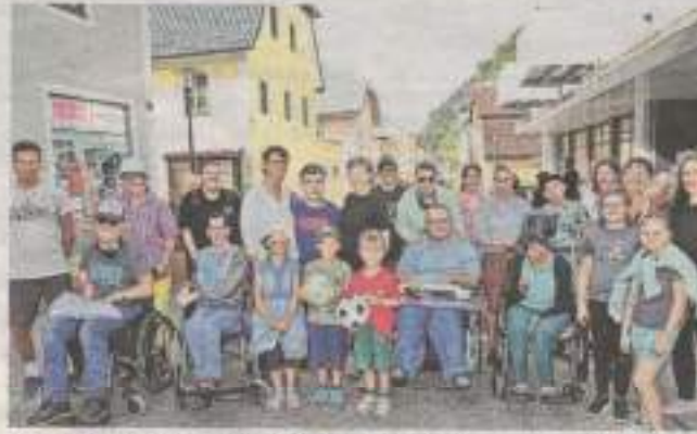
Sichtbares Zeichen für ein respektvolles Miteinander.

Das Straßenbild war geprägt von fußballspielenden und tanzenden Kindern, aber auch Erwachsene beteiligten sich aktiv am Geschehen. Viele nutzten die Gelegenheit, den Straßenraum einmal ohne motorisierten Verkehr zu erleben und die Gemeinschaft in ungezwungener Atmo-