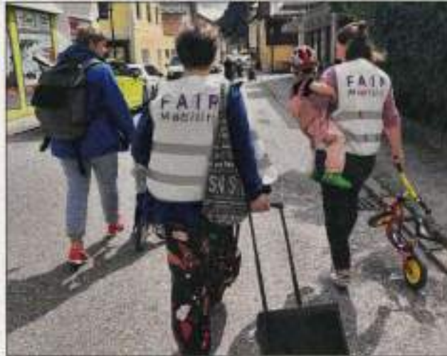
Für eine sichere und faire Mobilität setzt sich die Gemeinde Ebensee am 28. August ein. Frauenforum Salzkammergut

Gemeinsam mit dem Bluten Kinderhort, der Tageseinrichtung M3 und der Marktgemeinde Ebensee organisiert das Frauenforum Salzkammergut ein Straßenfest mit Action statt Autos, zu dem alle Ebenseer eingeladen sind. Mitglieder des SV Ebensee und der Tanzgruppe Spirit of Teams bereichern die Veranstaltung mit Angeboten. Gerade für jene Verkehrsteilnehmer, die nicht mit dem Auto