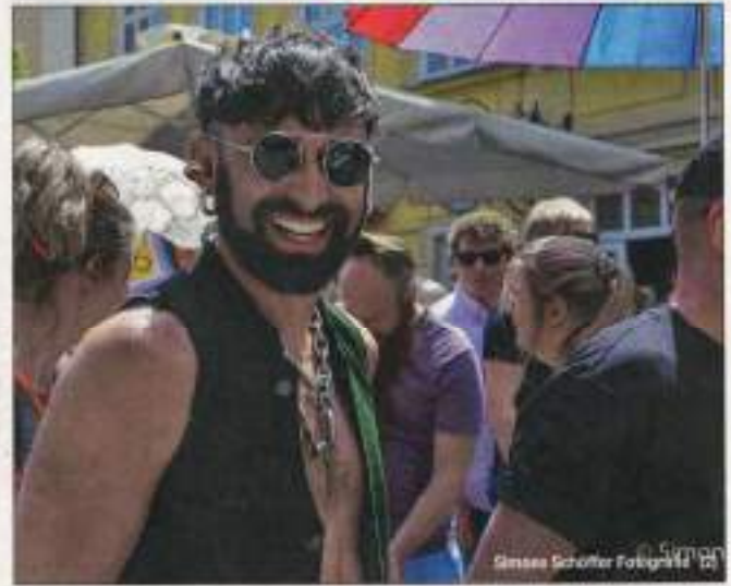
ABBILDUNG 12 – ISCHLER WOCHEN, 13. AUGUST 2025