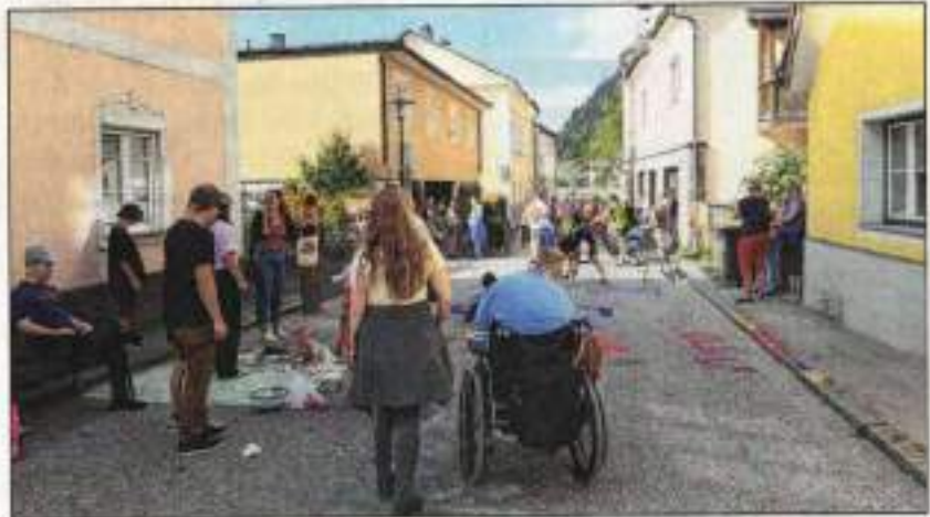
ABBILDUNG 2018 - ISCHLER WOCHEN, 17. SEPTEMBER 2025

Im Rahmen des Aktionstages „Ebensee in Bewegung“ soll das Zentrum in einen Ort der Begegnung verwandelt und das Tempo des Straßenverkehrs auf natürliche Weise gedrosselt werden. Frauen*forum Salzkammergut