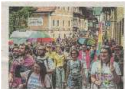
2.500 Menschen nahmen an der Pride in Bad Ischl teil.