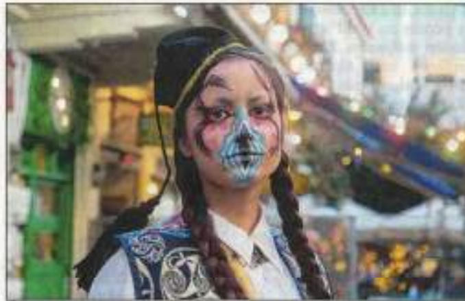
Der griechische Dokumentarfilm Avant-Drage! Radical Performers Re-Imagine Athens von Fil Ieropoulos startet um 18.30 Uhr.

Um 18.30 Uhr beginnt der Film Avant-Drage! Radical Performers Re-Imagine Athens. Der griechische Dokumentarfilm von Fil Ieropoulos (2024, OmdU, 92 Min) bietet eine Stadtführung der anderen Art: Zehn Drag-Performer unterschiedlicher geschlechtlicher Identitäten, Sexualitäten und Herkünfte dekonstruieren in radikalen und surrealen Performances Geschlecht, Sexualität, Nationalismus, Religion und Ethnizität im öffentlichen Raum Athens. Abseits des glitzernden Mainstreams wird Drag hier zur glamourösen Protestform – widerständig gegen Polizeigewalt, Transphobie und Rassismus. Die Collage porträtiert eine schillernde, zärtliche „Com-