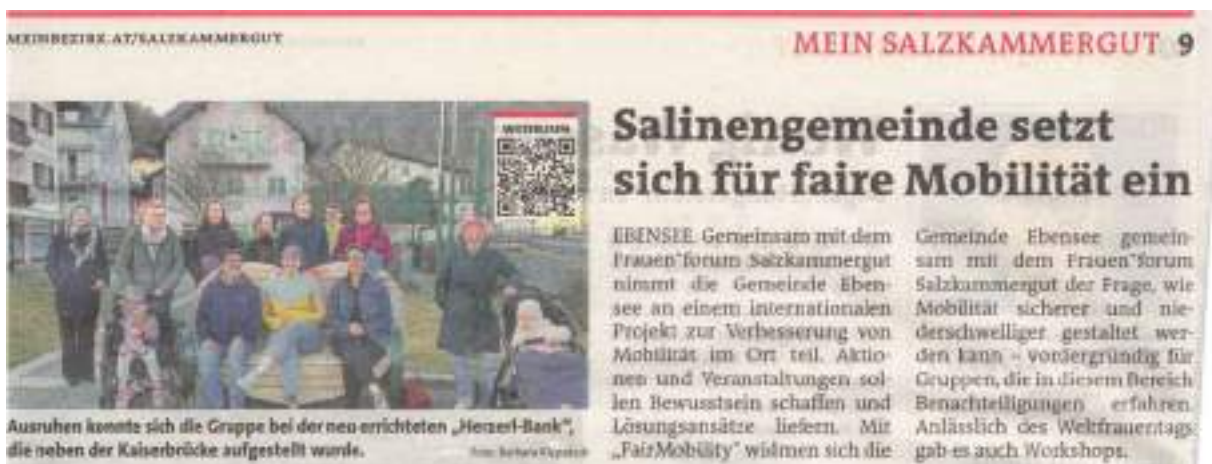
ABBILDUNG 2 – BEZIRK RUNDSCHAU, MÄRZ 2025