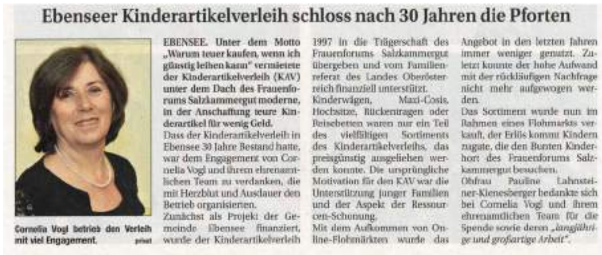
ABBILDUNG 1 – ISCHLER WOCHEN, 26. FEBRUAR 2025