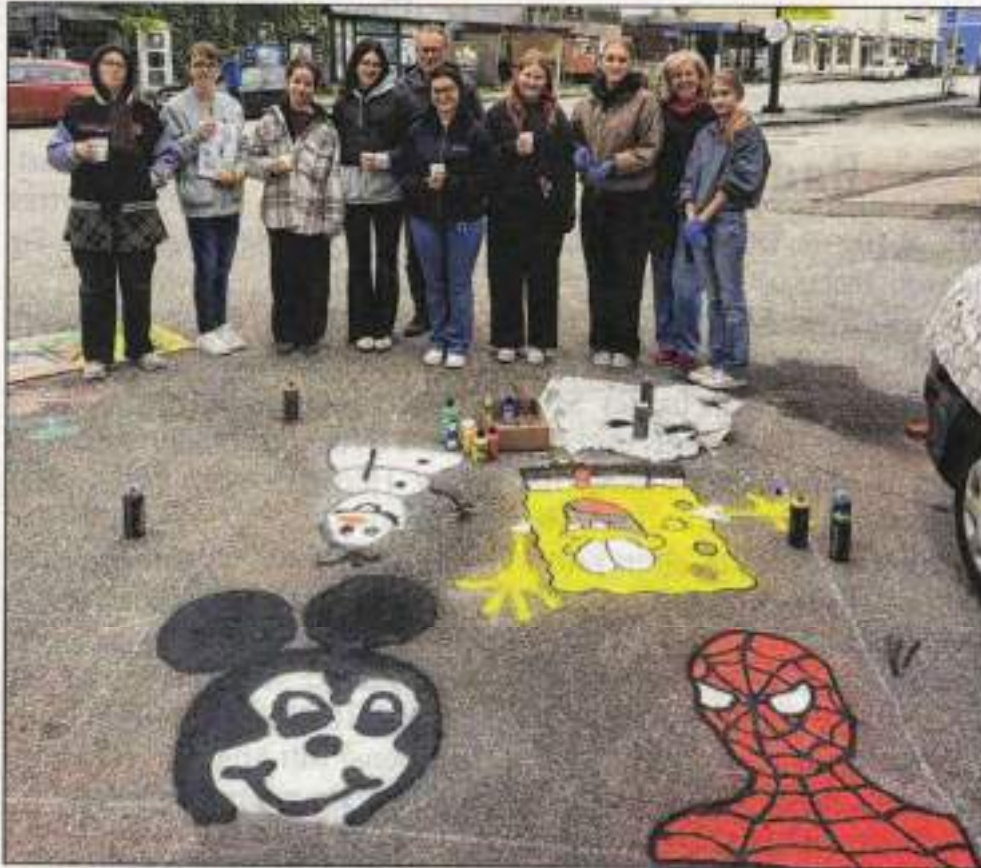
Micky Maus, Spiderman und Co. begrüßen die Volksschüler und deren Eltern ab sofort bei der „Elternhaltestelle“. Frauen*forum Salzkammergut

EBENSEE. Ein besonderes Geschenk machten Schüler und Lehrer der Höheren Lehranstalt für Mode den Kindern und Eltern der Volksschule Ebensee. Für die zukünftige Elternhaltestelle beim Rathauspark fertigten sie ein Graffiti mit verschiedenen Figuren aus der Welt der Volksschulkinder an.