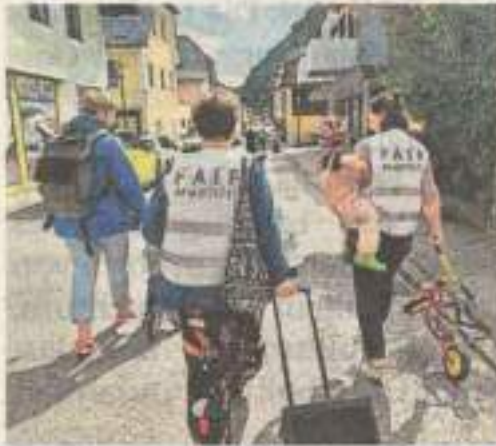
Für ein faires Miteinander im Straßenverkehr.

EBENSEE. „Straßenraum fair teilen“ lautet das Motto der „Hauptstraßen-Gaudi“, einer Veranstaltung, bei der die Ebenseer Hauptstraße am 28. August von 9 bis 11 Uhr für zwei Stunden jenen gehört, die im Straßenverkehr oft den Kürzeren ziehen. Gemeinsam mit dem Bunten Kinderhort, der Tageseinrichtung M3 und der Marktgemeinde Ebensee organisiert das Frauen*forum Salzkammergut ein Straßenfest mit Action statt Autos, zu dem alle Menschen aus Ebensee eingeladen sind. Mitglieder des SV Ebensee und der Tanzgruppe Spirit of Teams bereichern die Veranstaltung mit Angeboten. Gerade für jene Verkehrsteilnehmende, die nicht mit dem Auto unterwegs sind, kommt es in der Ebenseer Hauptstraße zu gefährlichen Situationen. Teilweise fehlt die Sicherheit eines ausreichend breiten