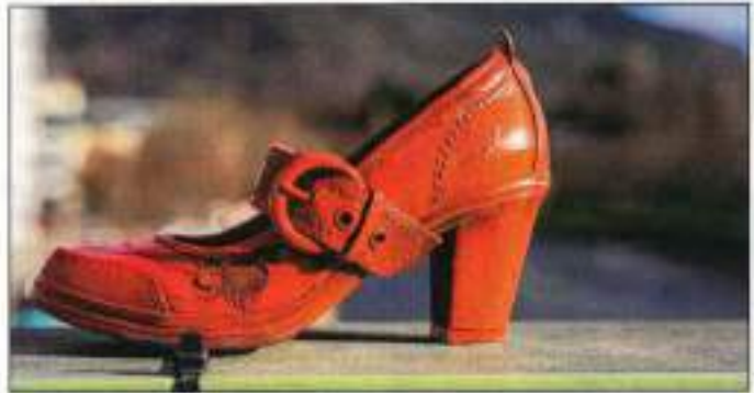
Jedes rote Schuhpaar am Montag, 1. Dezember, um 15 Uhr am Ischler Sparkassenplatz soll ein ausgelöschtes Frauenleben darstellen. CHRIS GAN

BAD ISCHL/EBENSEE. Von Dienstag, 25. November, bis Donnerstag, 10. Dezember, steht die Welt wieder im Zeichen der UN-Kampagne „Orange the World“.