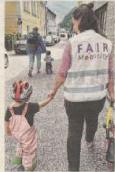
Die Kinderwagen-Roas startete beim Rathaus und führte durch die engen Straßen des Ortszentrums.

Auf dem Weg sorgten mehrere Stationen für Unterhaltung bei den Kindern und boten den Erwachsenen Gelegenheit zum Austausch. Die Kinderwagen-Roas wurde von Fair Mobility organisiert – einem Projekt, das sich für mehr Sicherheit und gleichberechtigten Zugang zum öffentlichen Raum einsetzt. Dabei soll das Bewusstsein geschärft werden, wie Verkehrsplanung und Rücksichtnahme das Miteinander im Straßenverkehr beeinflussen. Ziel ist ein