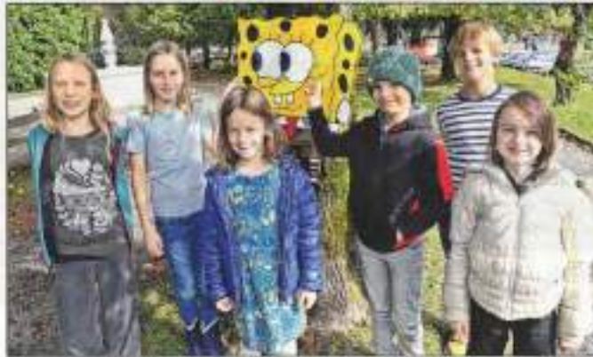
Von nun an werden die Kinder von farbenfrohen Bildern, etwa von Spongebob Schwammkopf, auf dem Schulweg begleitet.

Gemeinsam mit der Marktgemeinde Ebensee, dem Elternverein, dem Frauenforum und im Rahmen des Projekts „Fair Mobility“ wurde am in der Hauptstraße, beim Eingang zum Rathauspark, eine neue Elternhaltestelle eingerichtet. Von dort aus sollen die Kinder künftig zu Fuß durch den Rathauspark und über die Dienertiege zur Volksschule gehen. Der neue Schulweg ist völlig autofrei - und damit nicht nur sicher, sondern